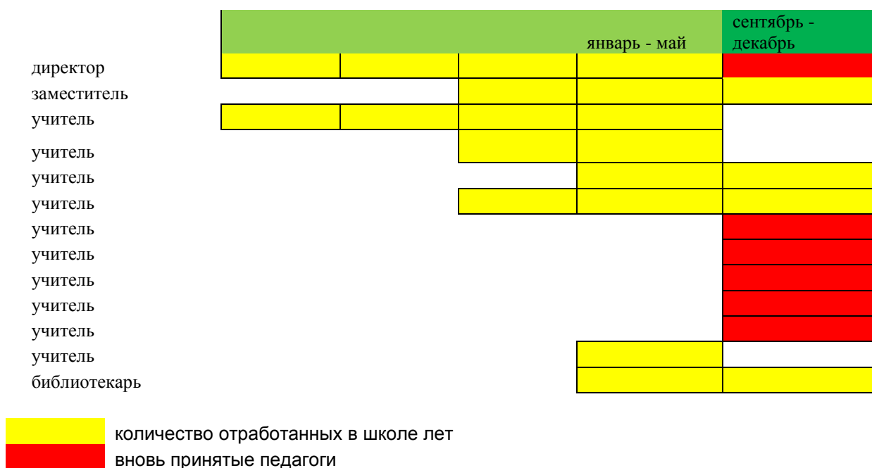
Рис.3. Динамика сменяемости педагогического коллектива школы в 2019 году

Сменяемость административного персонала составила 50%, педагогического коллектива - 64%. Одним из способов нивелирования выявленной проблемы через сокращение сроков «вработываемости» может стать высокий уровень профессиональных компетенций педагогов и сопровождение вновь принятых педагогов по передаче традиций школы, школьного уклада.